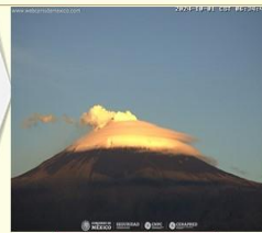
Imagen destacada de las últimas 24 horas

CON LA PARTICIPACIÓN DEL INSTITUTO DE GEOFÍSICA DE LA UNAM